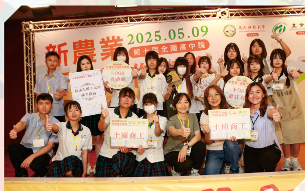
▲國立土庫商工學生作品獲得優等獎