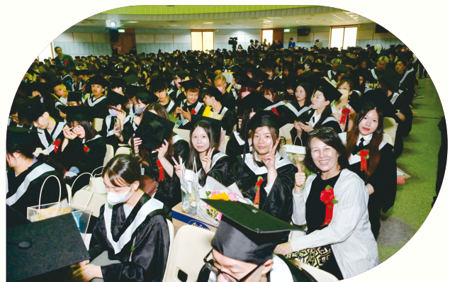
▲畢業生與導師合影