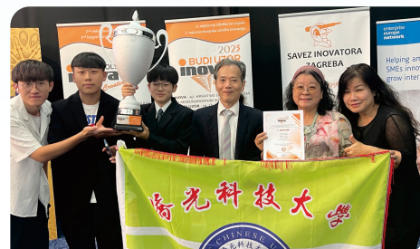
▲ 創設系榮獲2024克羅埃西亞國際發明展3金3特別獎大滿貫