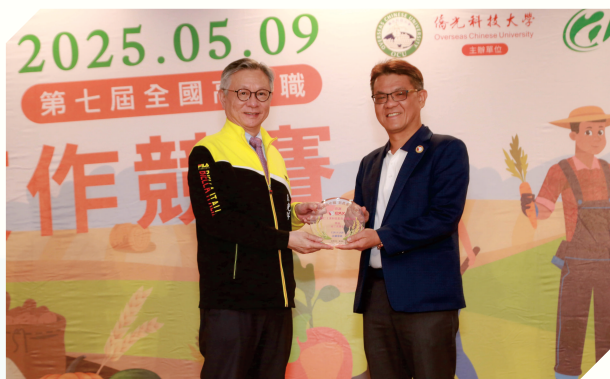
▲校長致贈感謝獎牌予校友會理事長

校 長、各位貴賓、老師及同學大家好： 非常榮幸回到母校參加這次活動，並且與母校聯名贊助這次競賽。也很高興看到母校老師以及未來可能成為學弟妹的高中職同學們。我家裡也有一個素食農業推廣中心，提供社區民眾免費用膳。今天看到很多學生對於農產品行銷非常刮目相看，但看到大家用盡所學努力推銷，真的覺得國家未來非常有希望。這幾年產業界遇到非常多的挑戰，需要更多的生力軍投入，需要有新思維、新能力加入，今天有機會看到25組傑出的成果展現，真的非常開心。農業結合商業行銷是非常新穎的潮流，相信台灣的農業推廣會更好。讀萬卷書不如行萬里路，十分鼓勵同學多到各行各業體驗或參訪，未來結合各位所學，帶給產業更新的思惟。謝謝大家！