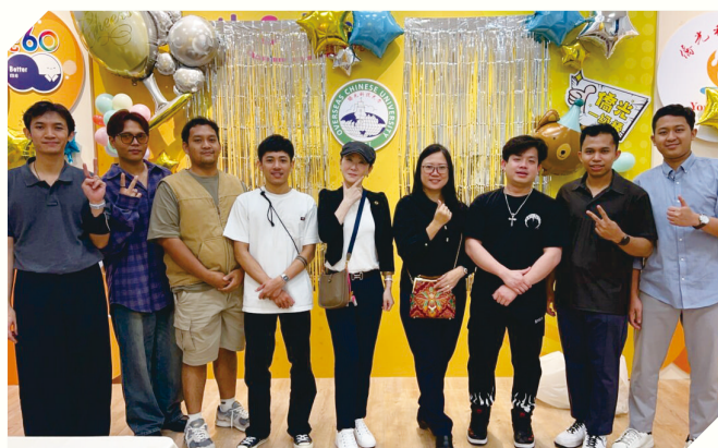
▲境外校友返校經驗分享