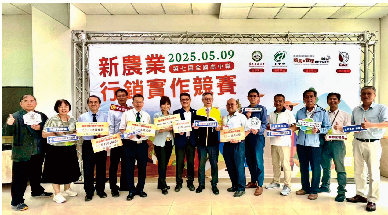
▲僑光科技大學第七屆農銷競賽，裕仁工業贊助 12 萬獎金，推動新農業行銷與永續發展