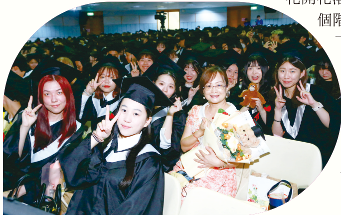
▲畢業生與導師合影