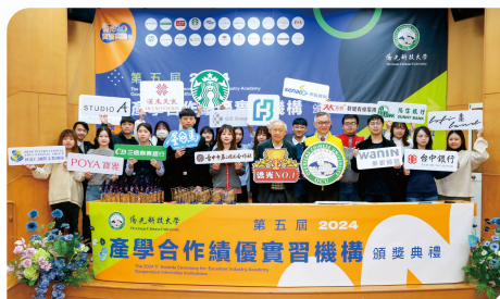
▲ 產學合作績優實習機構頒獎典禮，表揚留任學生成效卓著績優實習機構