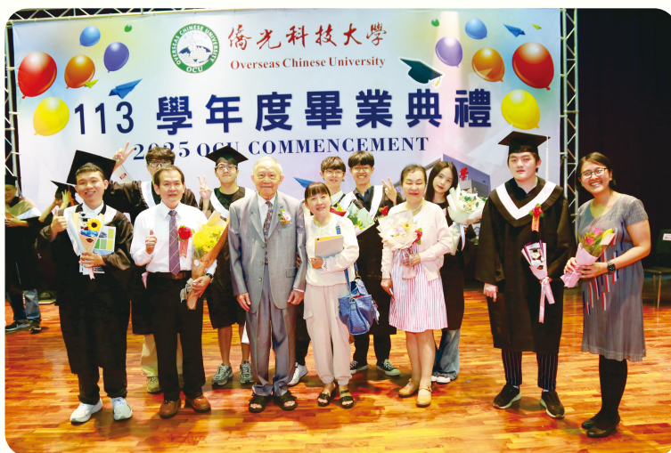
▲董事長與畢業班導師及畢業生代表合照