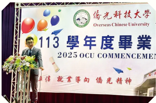
▲立法院江啟臣副院長親臨典禮為畢業生祝賀

僑光科大董事長陳伯濤則表示，僑光辦學一直秉持「明誠立信」校訓以深耕技職教育。因應環境變遷，不斷與時俱進，透過扎實的教學資源和創新科技設備，培養具國際競爭力的人才。期許畢業生在人生旅途上，將在僑光所學的知識和專業能力貢獻社會，並將寶貴經驗轉化為實際行動。面對多變的社會環境，繼續堅持著「凡事全力以赴，直到最後一分一秒永不放棄」的「僑光精神」。