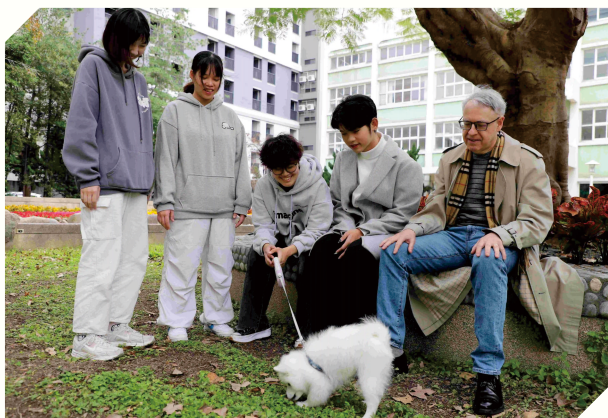
▲馮院長時常透過與年輕學子相處交流，了解如何調整教學方法。