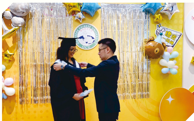
▲國際處處長為境外畢業生頒獎

畢業不只是結束，更是另一段旅程的開始。今天的重逢與祝福，將成為每一位境外生與專班校友心中最珍貴的回憶，也為他們邁向未來注入滿滿的勇氣與能量。