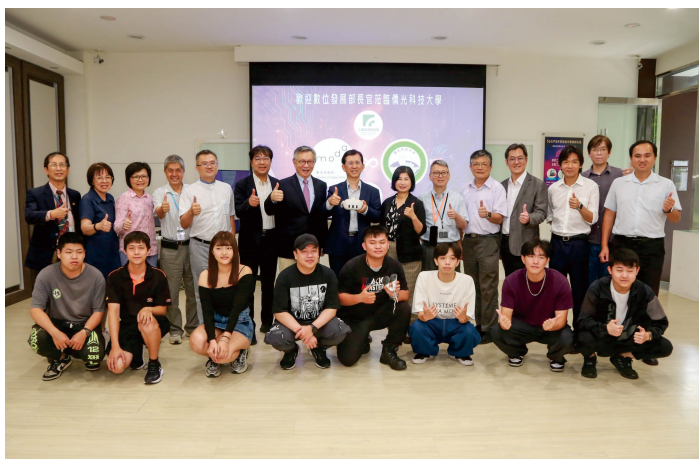
▲數發部團隊親臨僑光科大體驗5G元宇宙專業職能作業訓練平台

今天非常難得有機會來到僑光參訪，這次與數產署一起了解5G專網計畫結合元宇宙設計訓練工具，我們可以思考透過這些成果如何擴散，因為這個計畫到2024年結束，也謝謝工研院與僑光科大合作研發相關技術，希望未來可以在這些基礎建設延伸它的創新。我們也可以繼續思考如何持續支持這類創新應用的發展，並鼓勵更多學校與企業參與，共同推動台灣數位教育訓練發展。謝謝大家！