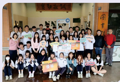
▲本屆競賽由草屯商工團隊喜獲冠軍與優等榮譽。