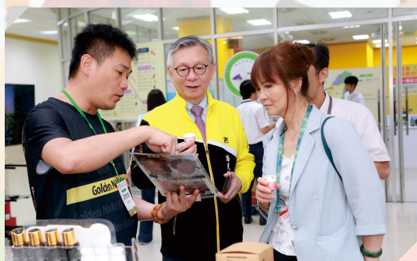
▲校長與來賓訪視小農產品