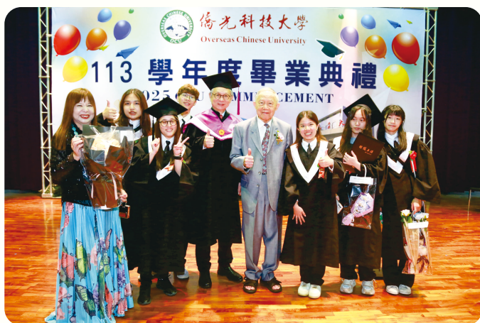
▲董事長、校長與畢業學生合照

Do your job. Finish what you start. No matter how long it takes, never give up.