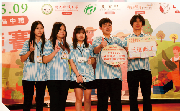
▲三重商工獲得優等獎