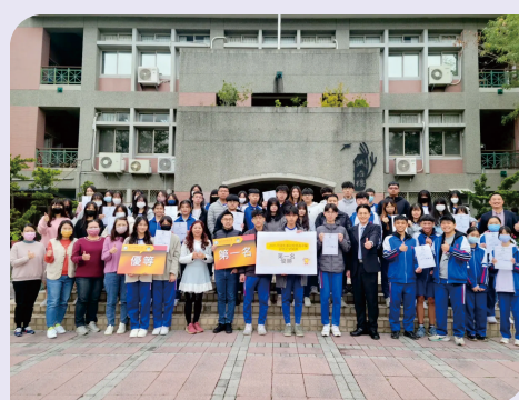
▲南投高商團隊獲得本屆競賽第二名及優等佳績。

未來，系上將持續與高中職學校的課程合作與共享，推動學生實作與業界實務接軌，期盼為台灣行銷教育注入更多創新動能，培育具備實戰力與創造力的行銷人才。