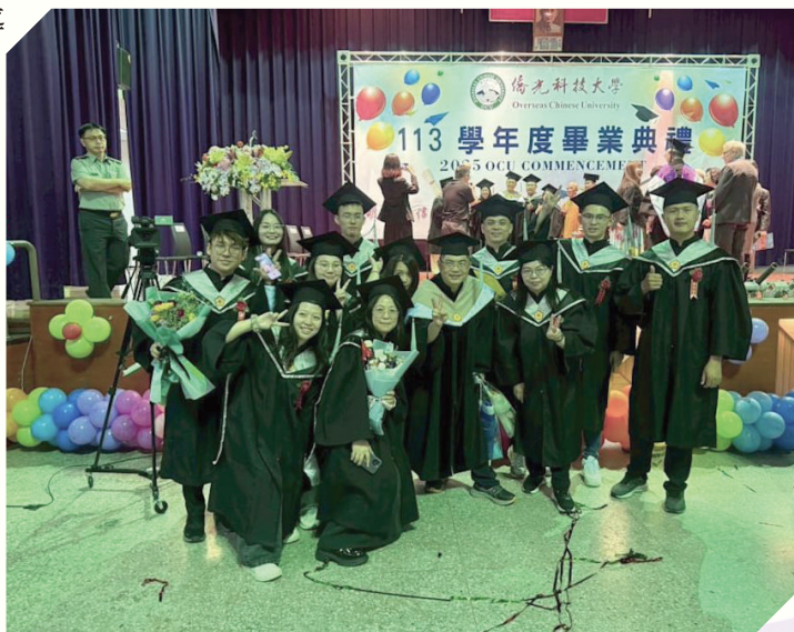
▲僑光科技大學財務金融系以「實習全學年」與「學碩接軌」兩大創新機制，打造「就學即就業」黃金路徑，成為中部區域熱門選系之一。

僑光科技大學指出，深化校外實習、學碩接軌與第三人生教育模組的整合推動，融合大數據、ESG金融、區塊鏈等趨勢課程，打造跨世代、跨技術的財金人才搖籃。