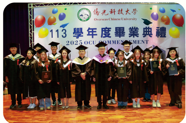
▲校長與各院畢業生代表合照