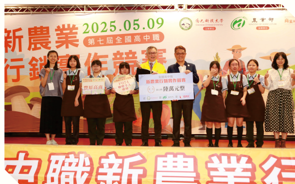
▲校友會理事長頒發總評第一名獎項