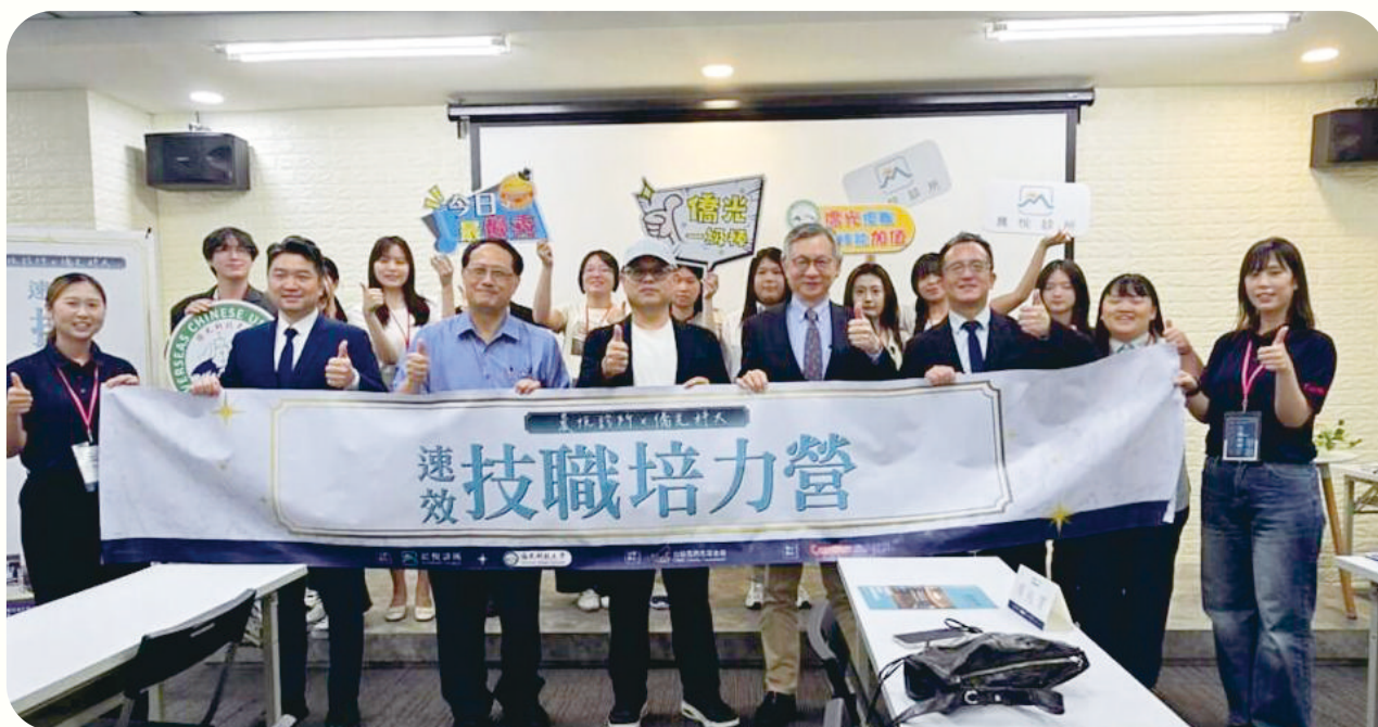
▲台積電慈善基金會速效培力營密集的實作與互動，全體僑光科技大學參與學生獲頒晨悅預防醫學機構的結業合格證書，完成百分百「畢業即就業」的目標。

這場培力營由僑光科技大學邀請在校學生參與，不限科系均可參加，經過一天密集的實作與互動，全體學生都收到晨悅預防醫學機構的結業證書，完成百分百「畢業即就業」的目標，讓年輕世代能兼顧職涯發展與家庭陪伴，進而鼓勵其在家鄉深耕、安身立業。計畫結合基金會「技職培力」理念，透過與在地企業攜手合作，建構多元實務學習與就業管道，開啟青年適性探索與實務接軌的機會，落實產學協作，實現人才培育與地方共榮的良性循環。活