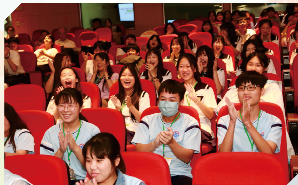
▲僑光科大農銷競賽，高中職與農友拚新農業